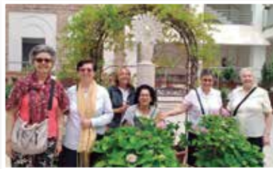
misioneras eucarísticas seglares de nazaret